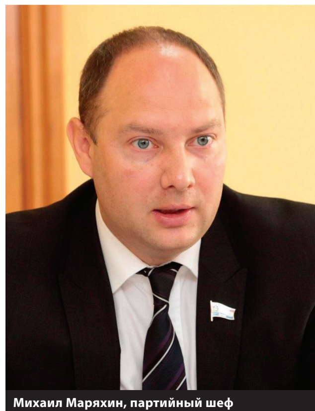
Михаил Маряхин, партийный шеф